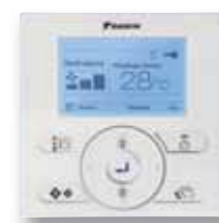
BRC1E53A en option