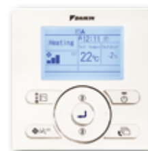
En option (BRC073)