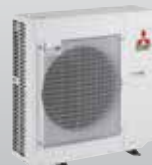
MXZ-5D102VA 5 connexions