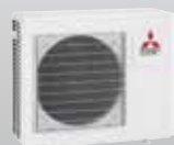
MXZ-3D54VA / MXZ-3D68VA 3 connexions