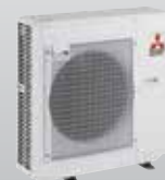
MXZ-6C122VA 6 connexions