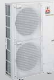
MXZ-8B140VA 8 connexions